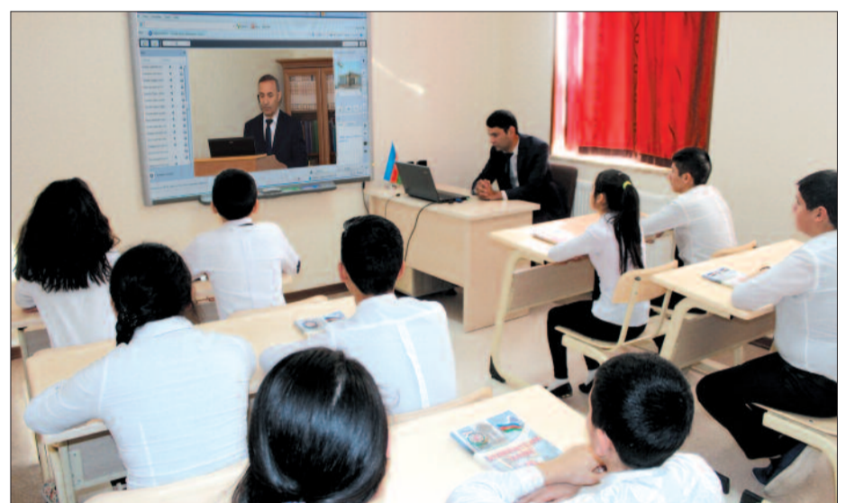
Şahbuz rayon Qızıl Qışlaq kənd tam orta məktəbi