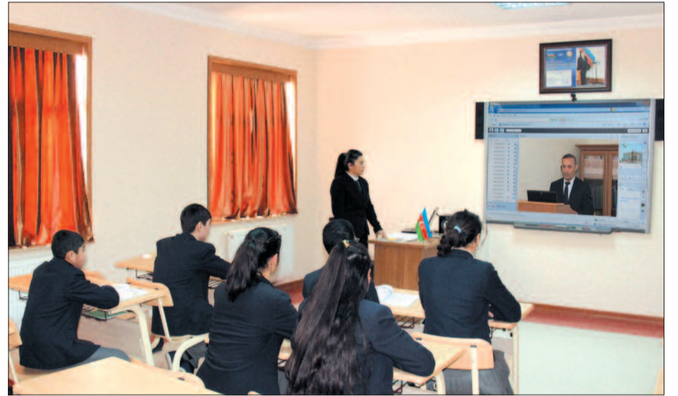
Şərur rayon Düzə kənd tam orta məktəbi