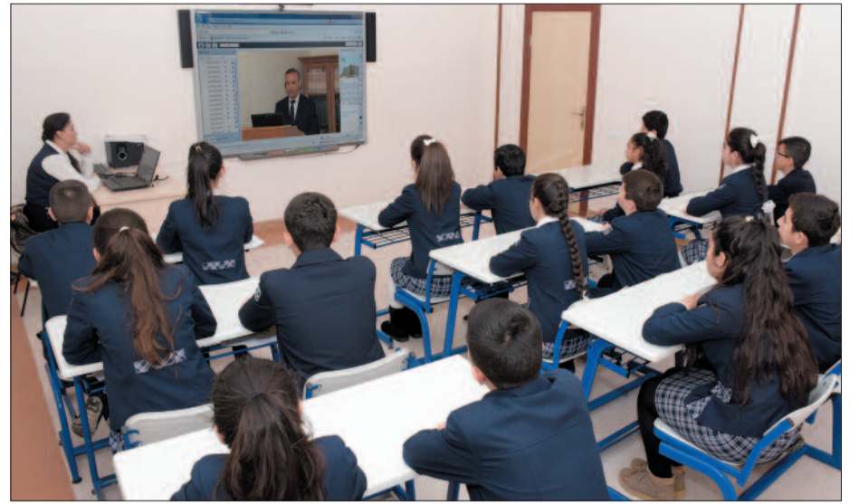
Naxçıvan şəhərindəki Heydər Əliyev adına tam orta məktəb